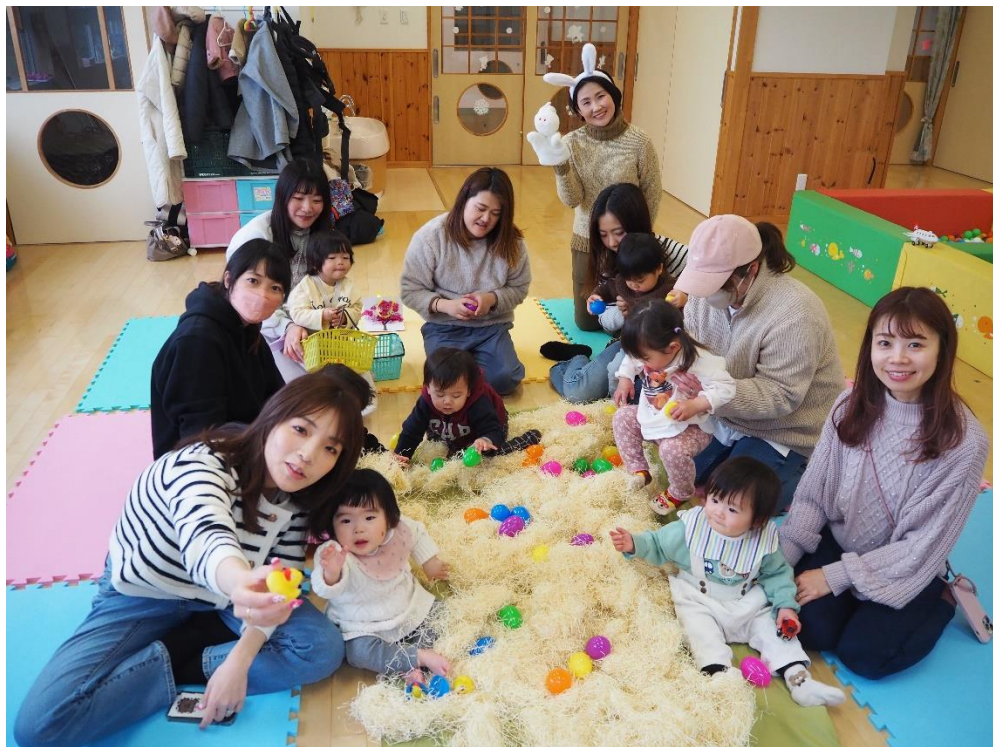
今月末はイースターがあるので、皆でエッグハントをしました!! エッグを見つけると「あった！」と大喜び♪ 大盛り上がりでした😊