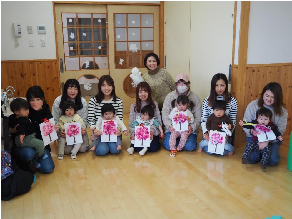
花紙を使って、桜の木を作りました!! 桜が咲くのが待ち遠しい〜♪