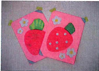
4/25 (木) 手型・足型アートいちご