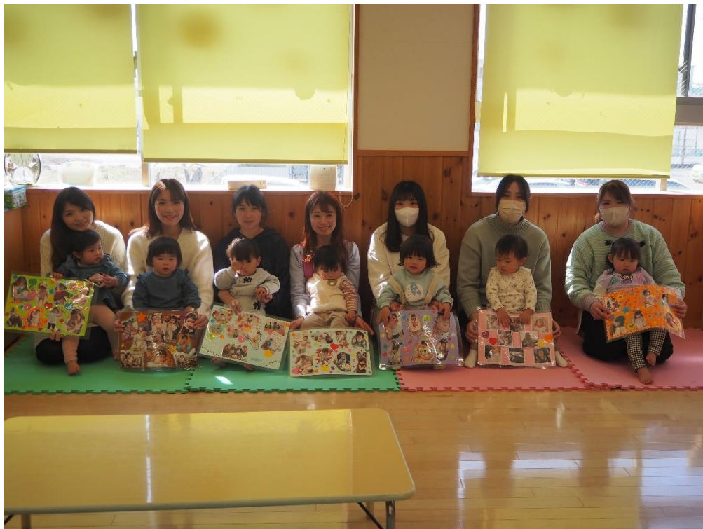
子どもたちの成長を振り返りながら、 思い出話にも花が咲き、思い思いに作り上げました！ 1年間参加して下さった皆様、ありがとうございました。