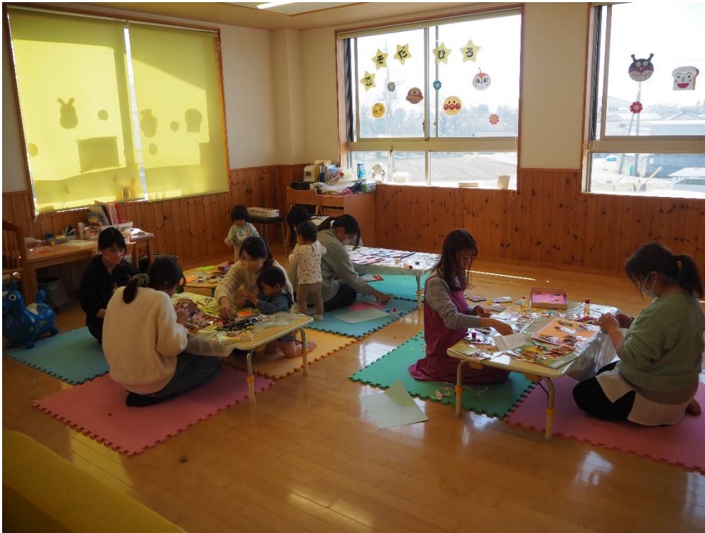
3月14日 フォトスクラップ作り 写真を持参して頂き、フォトスクラップ作りを行いました。