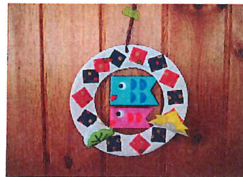
4/30 (火) こいのぼり製作